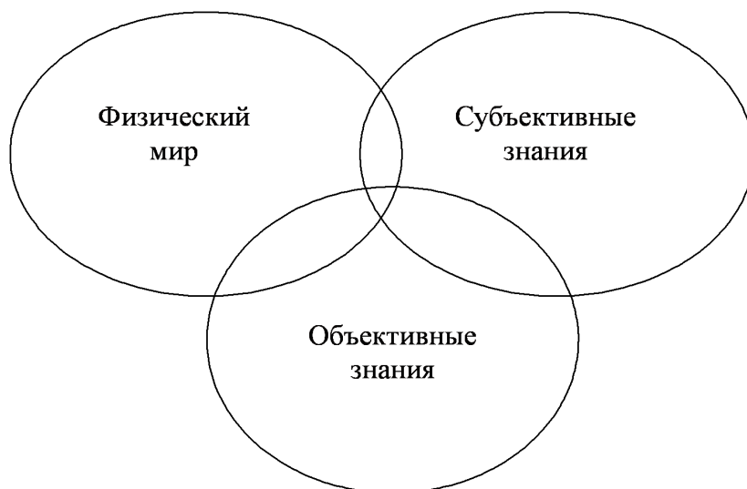
Рис. 2. Три мира окружающих нас сущностей

Необходимо отметить, что в данном случае объективными Поппер называет те знания, для которых существуют конвенциональные формы их представления в среде коммуникаций (например, тексты на естественном языке).